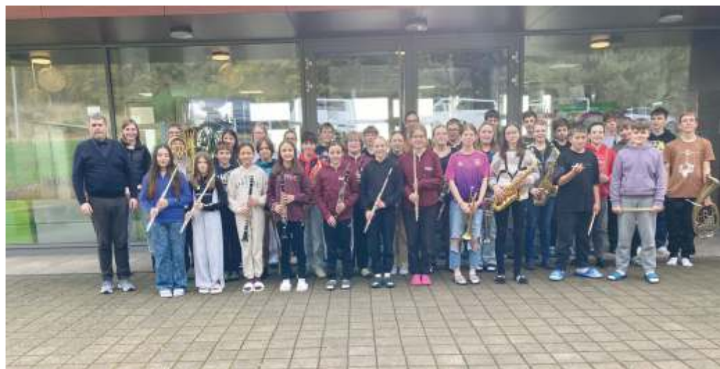
Freizeit JOS Kino Oberthal 2024