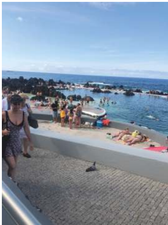
Porto Moniz Madeira