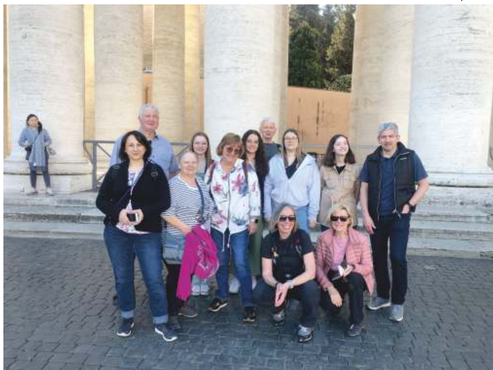
Auf dem Petersplatz