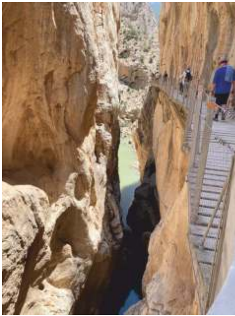
Andalusien - Caminito Del Rey