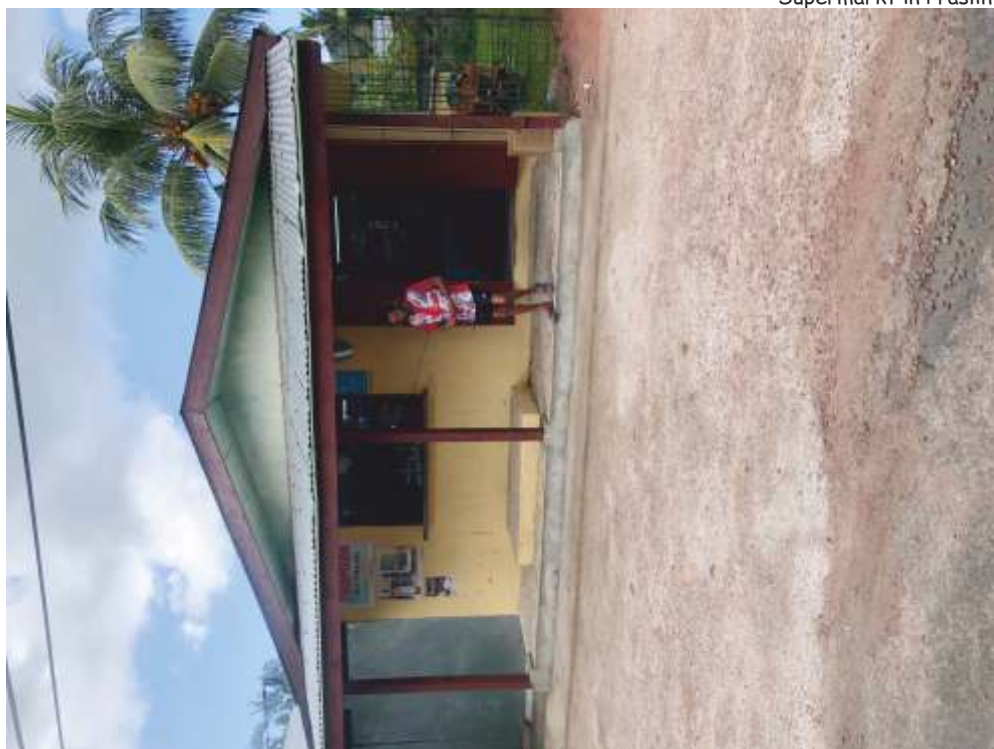
Supermarkt in Praslin