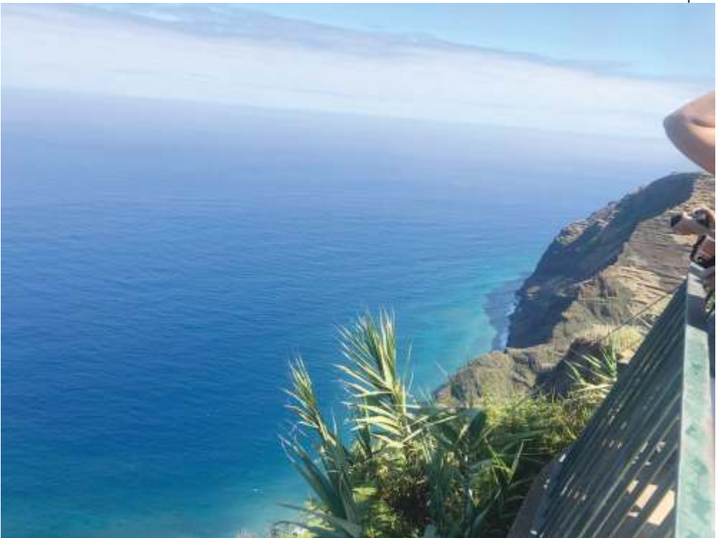
steilste Seilbahn Europas