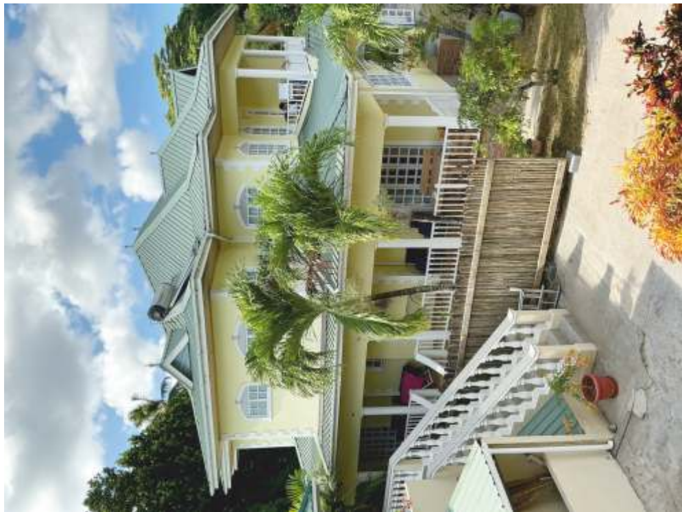
Captains Villa - Mahe