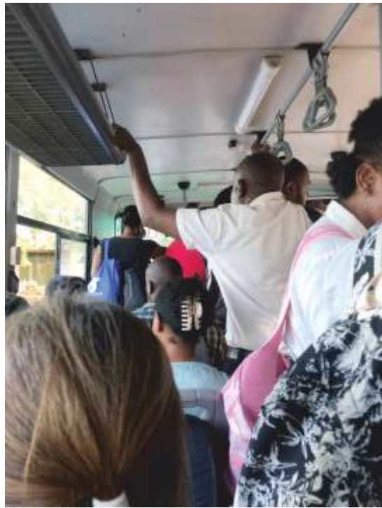
Praslin - im Bus