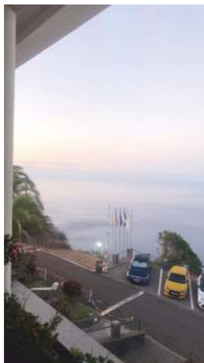
Blick aus Hotel