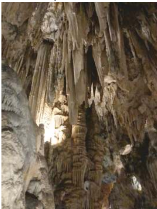
Andalusien - Nerja Höhle