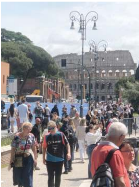
Rom - Kolloseum