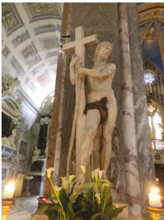
Rom - Jesu von Michelangelo